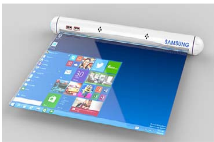
L'écran enroulable est annoncé pour l'année prochaine.

Le terminal est présenté dans les schémas sous deux formes. L'une est cylindrique et l'autre est rectangulaire. Les deux modèles fonctionnent de la même manière si ce n'est que l'écran de la version rectangulaire se plie à plusieurs reprises pour se ranger