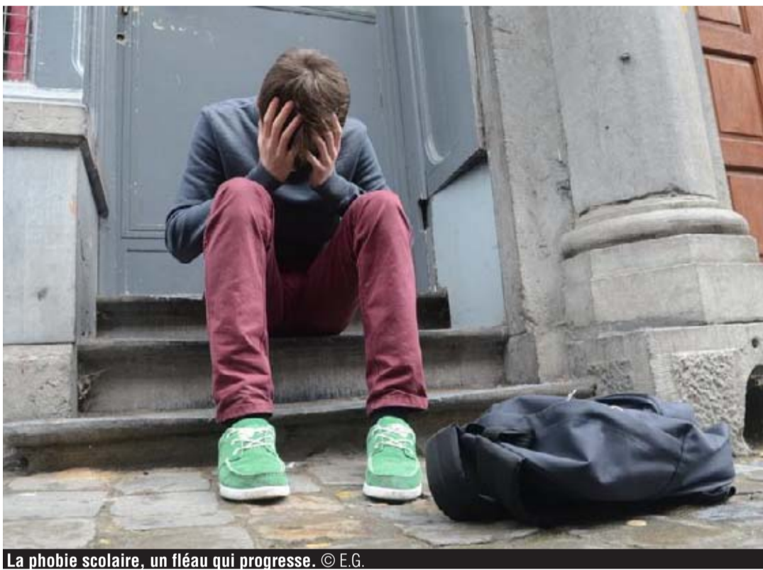
La phobie scolaire, un fléau qui progresse.

Il est clair que des partenariats entre professionnels de l'éducation, parents, écoles, centres PMS (psycho-médico-sociaux) et services PSE (de promotion de la santé) sont essentiels, « car il faut un réel effort collectif et une prise de conscience de l'ensemble des acteurs », poursuit-elle. M me Schyns rappelle que des mesures ont été lancées ces dernières années pour lutter contre le harcèlement à l'école : médiation par les pairs (les élèves eux-mêmes), un projet de l'Université de Mons pour redessiner les cours de récré et en faire des espaces moins conflictuels, etc. « Le rapport de cette recherche-action sera disponible à la fin de 2018. L'administration analyse les projets. Mais à peine