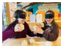
Photo utilisée pour la couverture : Handstand, projet de la Besace sensibilisant à différentes déficiences de manière active et ludique.

11 RESPONSIBLE YOUNG DRIVERS Les RYD à l'assaut des trottinettes